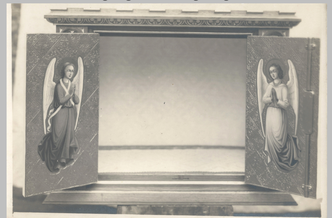
Tabernakel voor een kloosterkapel