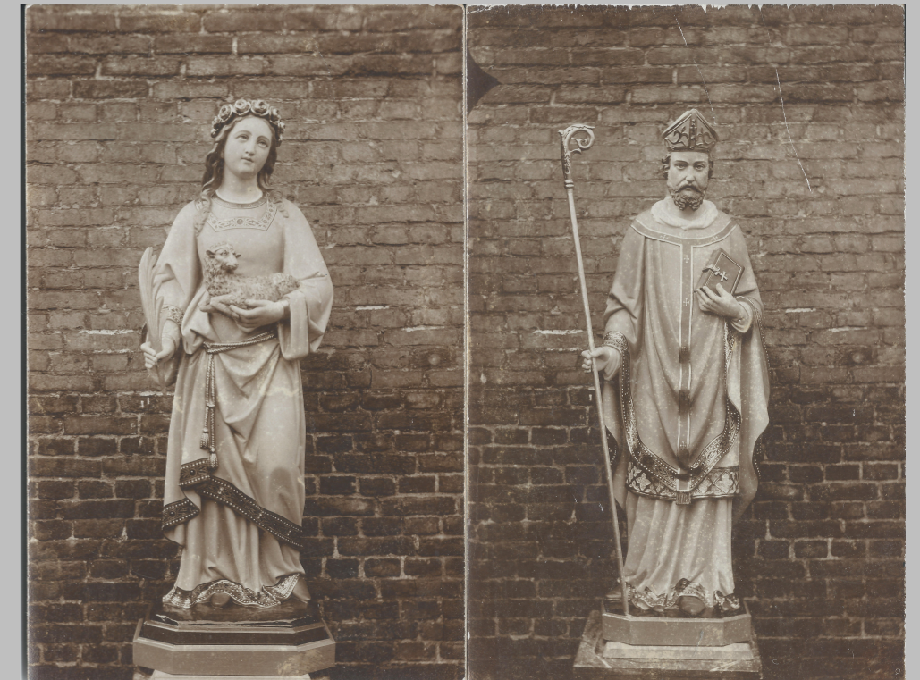
Heilige Agnes en heilige Augustinus

In een kamer aan de straatzijde had hij een winkelje ingericht waar hij zijn waren aan de man bracht. Beryngier maakte ook heiligenbeelden die hij decoreerde en beschilderde, hij schilderde en decoreerde ook tabernakels.