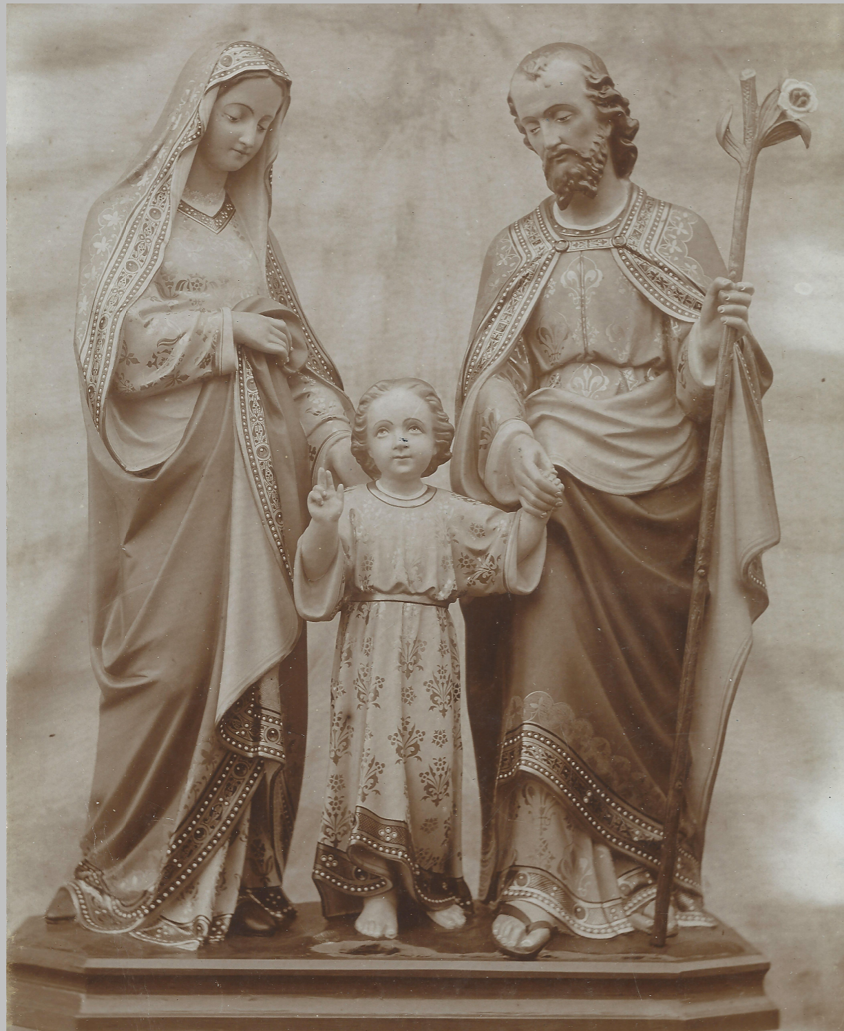
De Heilige Familie